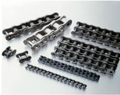
各種機器の伝導用としてあらゆる産業で活躍する『ローラチエン』