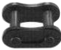
クローズタイプクリップ