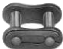
オープンタイプクリップ