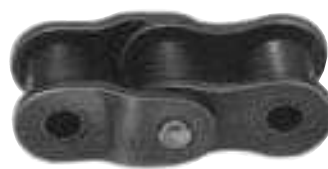
2ピッチ形 (KCM25、KCM03、04、05Bは2ピッチ形のみです)