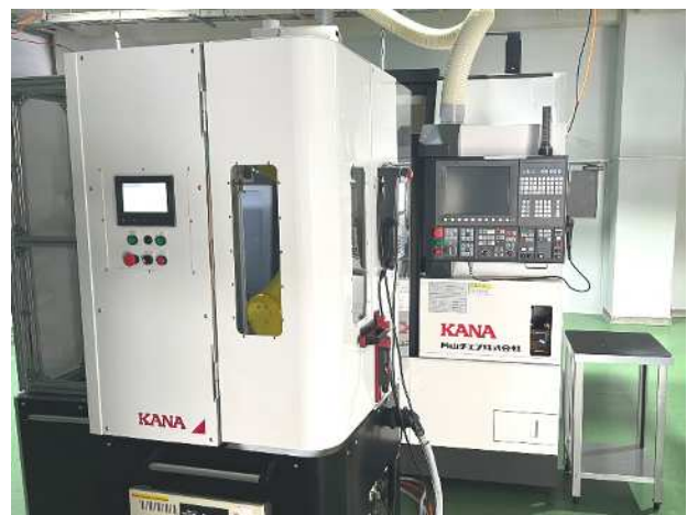
自動供給装置及び 工作機械