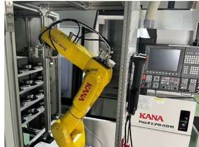
ロボットによる供給の様子