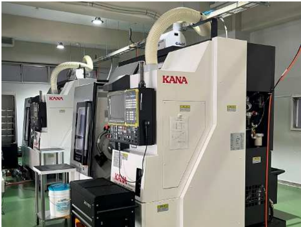
「追加サービス」専用工場の全体